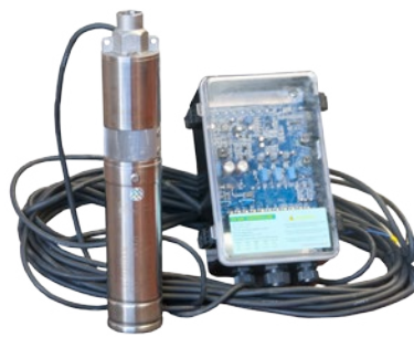
Bomba con 20 m. de cable y cuadro