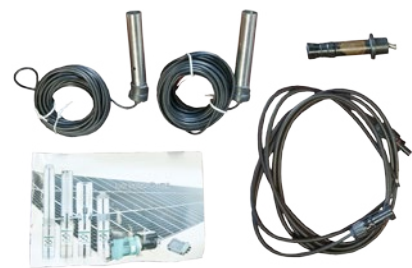
Sensores de nivel de agua y manual