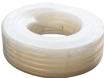
30 m. de manguera de 1/2"