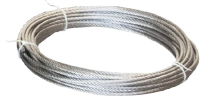
20 m. de cuerda