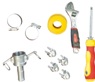
Herramientas y accesorios